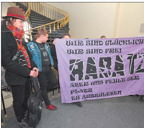
Zuschauer aus der autonomen Szene protestierten gegen den Prozess mit Transparent und Zwischenrufen.