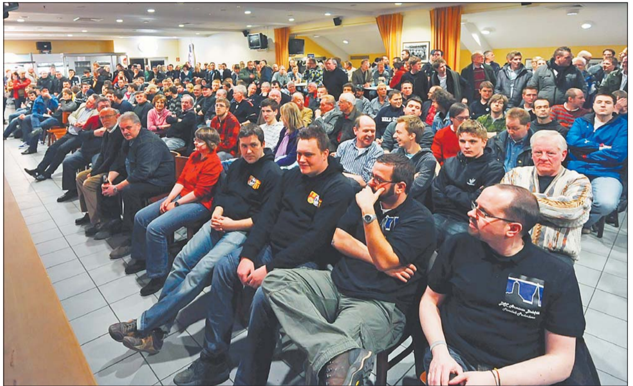
Die Arminia-Anhänger hören die Erklärungen der Klubfunktionäre zur harten Bestrafung des Zweitligisten. Die Reaktion der Fans reicht von Pfiffen zu Beifall für die offenen Worte.